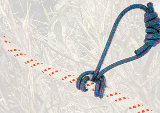
普魯士繩圈 (短x2, 長x1)